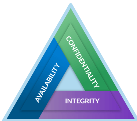
Obrázok 1 Model CIA

V zmysle základnej definície informačnej bezpečnosti bol definovaný základný model informačnej bezpečnosti. Model vychádza z charakteristík informácií, ktoré sú pre bezpečnosť dôležité a ich narušenie je kritické. Model sa označuje ako triáda CIA alebo trojuholník CIA (Obrázok 1) a bol prvým priemyselným štandardom pre oblasť bezpečnosti v období sálových počítačov.