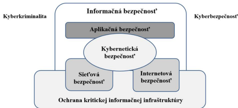
Obrázok 2 Informačná a kybernetická bezpečnosť